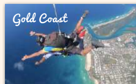
Beach Landing Tandem Skydive 880 booked ★★★★★