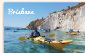
Riverlife Adventure Brisbane 340 booked ★★★★★