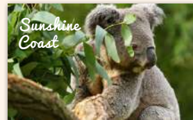
Australia Zoo Admission 863 booked ★★★★★