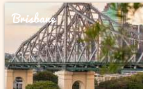
Story Bridge Adventure Climb 650 booked ★★★★★