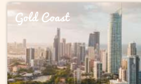
Gold Coast Nature & Wildlife Tour 550 booked ★★★★★