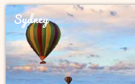
Hot Air Balloon Sunrise Flight 890 booked ★★★★★