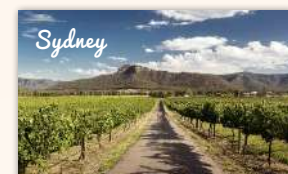
Hunter Valley Boutique Wine Tour 880 booked ★★★★★