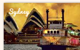
The Showboat Classic Dinner Cruise 498 booked ★★★★★