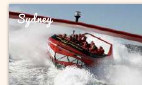
Sydney Harbour Oz Jet Boating Shark Attack Thrill Ride 650 booked ★★★★★