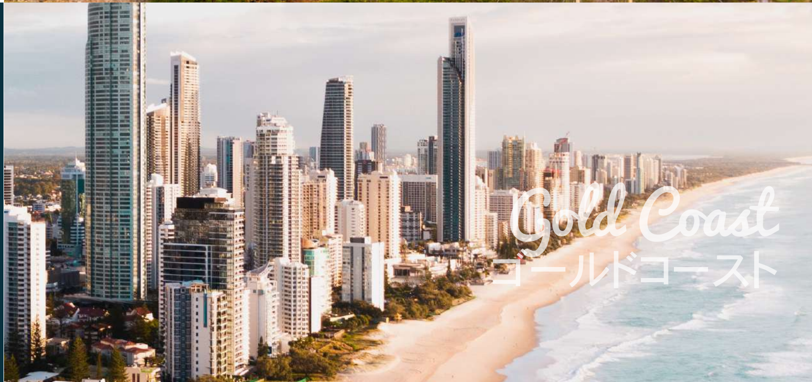
Gold Coast ゴールドコースト