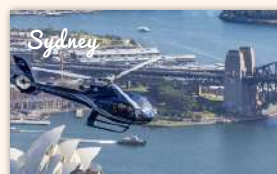
Helicopter Flight over Harbour 536 booked ★★★★★