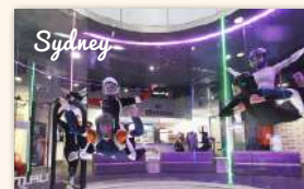
iFLY Downunder Indoor Skydiving 330 booked ★★★★★