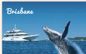
Tangalooma Island Resort Day Trip 1200 booked ★★★★★