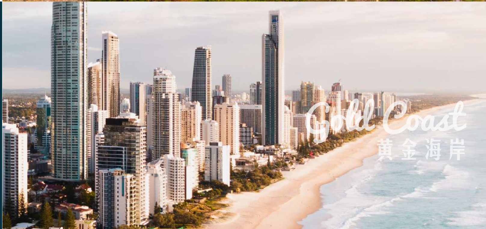
Gold Coast 黄金海岸