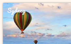
Hot Air Balloon Sunrise Flight