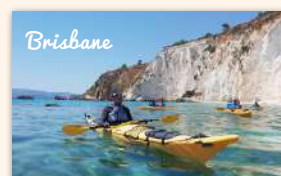
Riverlife Adventure Brisbane