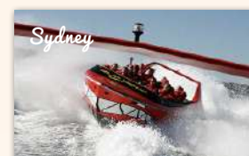
Sydney Harbour Oz Jet Boating Shark Attack Thrill Ride