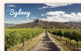
Hunter Valley Boutique Wine Tour