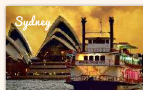
The Showboat Classic Dinner Cruise