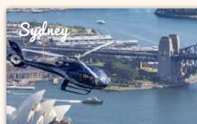
Helicopter Flight over Harbour