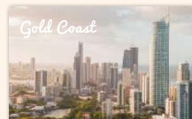
Gold Coast Nature & Wildlife Tour