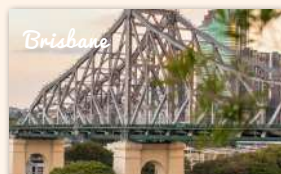
Story Bridge Adventure Climb