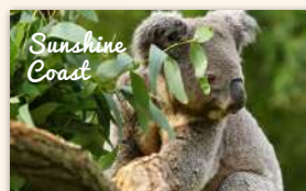
Australia Zoo Admission