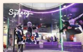
iFLY Downunder Indoor Skydiving